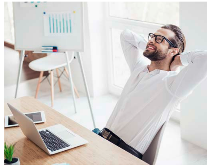
Das Neuroimagination-Coaching macht im Prinzip das, was sonst im Traum passiert. Durch Entspannungsübungen wird der Körper zuerst heruntergefahren

Alltagstraumata können uns alle jederzeit treffen. Oft werden sie in ihrer Wirkung unterschätzt oder gar nicht erkannt und die gravierenden Folgen werden nicht in Zusammenhang gesehen (Krae-